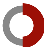
INFOSERVE RECHENZENTRUM & CLOUD